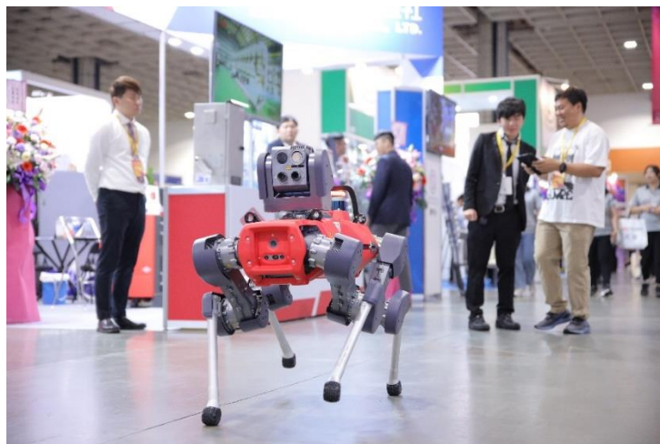
圖 3: 初次登場救災機器狗展現消防強大能量

安全產業歷經技術升級與蛻變，與不同領域的產業界線更加模糊，現場可以發現 AI 無所不在，不僅是「AI 創新應用走廊」的廠商: Panasonic、Micron、羅傑斯、AXIS、守護者聯盟、InventAI、TCIT、陽明交大、Honeywell、台灣人工智慧協會、富萱、皓博、威煦等，展出最新的 AI 軟硬體技術方案，幾乎全場的展商都推出智慧應用方案，AI 技術儼然已成為絕對標配。同時，許多廠商紛紛自組生態系、與合作夥伴共同推出自己的解決方案與平台。值得一提的是包含晶睿、利凌、昇銳、杭特、深微、立承、建騰創達...等台灣安控大廠久違齊聚，他們不僅展現 AI 賦能的智慧安防系統，並且更著重於垂直市場（行業）的整體應用解決方案，如交通、軌道、工廠、建築、商場、醫療等。門禁、對講等業者推出了與自家夥伴整合的全方位解決方案，並加入了平台、大數據分析和 AI 功能，展現了整體行業的發展趨勢。