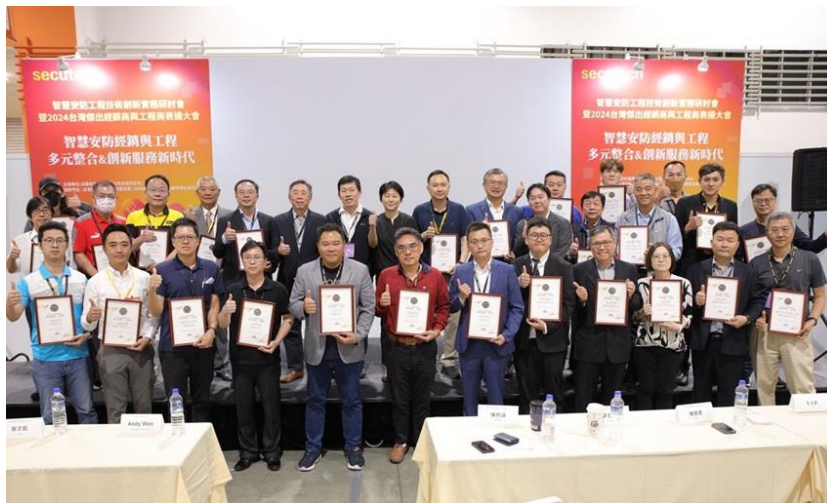
圖 4: 2024「智慧安防工程技術創新實務研討會」暨 「台灣智慧安防傑出經銷/工程商」30強表揚大會，4/26圓滿舉行!

此外，今年的消防防災展現出強大的產業能量，展商與展品豐富多元堪稱近年來之最，包括台灣能美、宏力、清谷、誼信、清谷、大府...的智慧火警滅火系統；正德防火、景同、寶仕、力宗及大來重工推出符合各災害型態所需的新型消防車；在智慧防救災的部分，無人載具成為今年的亮點，包含創思航太(凱洛克)的救災機器人、雲科大的熱區偵檢機器人、雲創隆的救災機器狗 Any Mal、翔隆航太各式無人機；金宏安全、允和科技的 AR/VR 消防模擬訓練；吉翔潛水、永亮、新銳動能的水域救援設備等以因應各類災害所需。為因應各類型科技廠房所帶來的新型災害事故發生，智慧工廠&工安環衛專區更有針對儲能系統(站)、鋰電池滅火提供最新解決方案。