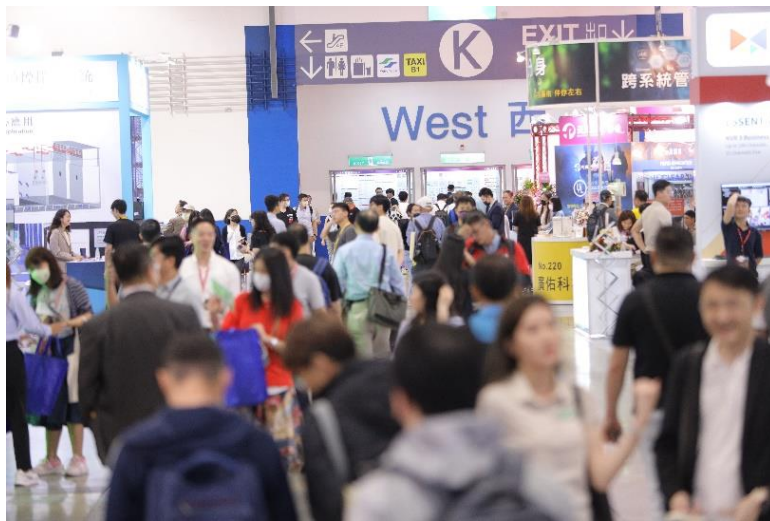
圖 1: secutech2024 共計 15,123 位海內外參觀者一同共襄盛舉

(台北訊-4月30日) 亞洲年度安全科技盛會【第二十五屆台北國際安全科技應用博覽會 (Secutech 2024)】與 5 大子展--「亞太智慧運輸展」、「台北國際智慧軌道展」、「台北國際智慧物聯建築與居家環境應用展」、「台北國際防火防災應用展」及「工業安全與管理年會」，4月26日於南港展覽館圓滿落幕。共計展出 13 國、300 家展商、515 個攤位的上千種安防、消防防災與科技應用解決方案；並邀請到來自 61 國 15,123 位海內外參觀者共襄盛舉，現場更有 7 國 69 家的買主團進行 93 場次導覽，各界齊聚、熱鬧交流！