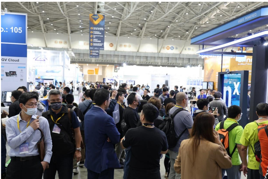
【圖一】來自不同產業之專業人士匯聚於 Secutech 對最新安全應用解決方案展現高度興趣。